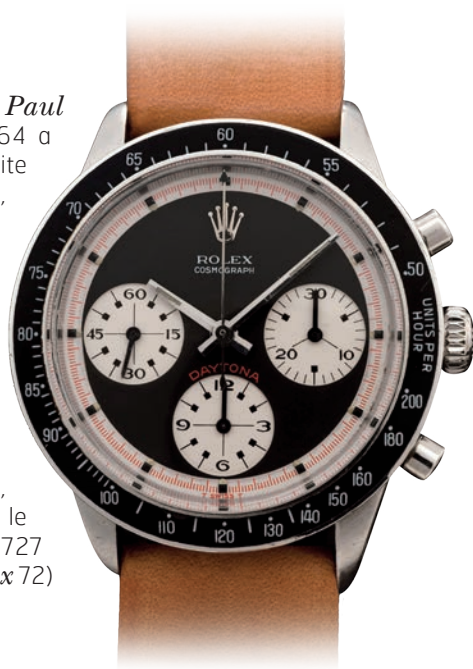
Collection Precious Time : Rolex Daytona Paul Newman, réf. 6264

La Rolex Daytona Paul Newman , réf. 6264 a seulement été produite pendant deux ans, de 1970 à 1972 et est aujourd'hui considérée comme une des Rolex Daytona Paul Newman les plus recherchées. Caractérisée par les poussoirs ronds et la lunette noir émaille, la référence 6264 a le mouvement Rolex 727 (dérivé par le Valjoux 72 )